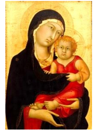
聖母子像〔マルティニ〕

今年のマリア祭は13日にありますが、5月を通してマリア様の生き方を知り、その生き方にならうことができればと思います。学校全体のテーマは「聖母マリアの心を学ぶ」ですが、ステージ毎に次のようなテーマを設定しています。