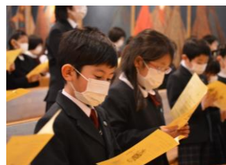
グロリア♪グロリア♪

おごそかな雰囲気の中、キャンドルを灯してイエス様のご降誕をお祝いする祈りのつどいが行われました。9年生有志や高校の合唱部も聖歌を演奏してくださり、たくさんの児童生徒がクリスマスの喜びを分かち合いました。