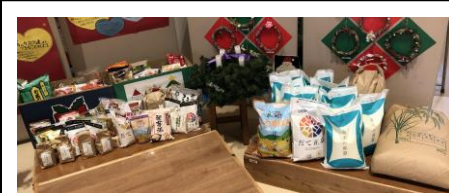
お米も馬小屋のそばに飾りました。