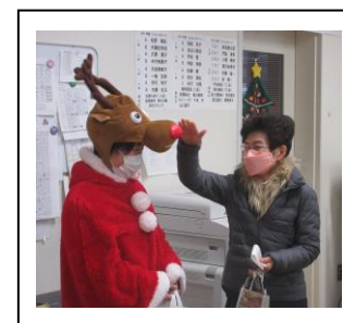
校長先生にもお届け!