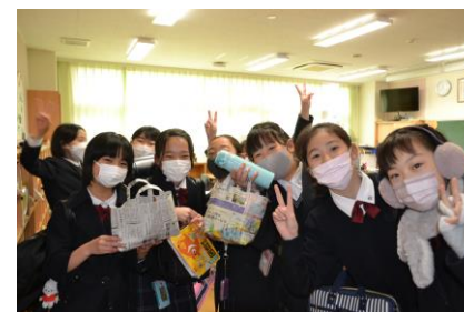
クッキーは新聞エコバックに入っていました!