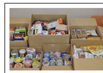
たくさんのフードが集まりました。