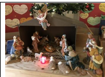
プレゼビオ(馬小屋かざり)

保護者の皆さまの惜しみないご協力でたくさんの献金、お米&フードが届きました。集まった品々は、23日(木)宗教ボランティア委員でもあるバドミントン部員がカトリック教会その他へお届けする予定です。献金も含めた詳細については、来年1月頃ご報告いたします。ご協力ありがとうございました。