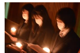
キャンドルサービス