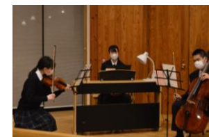
9年生ピアノ三重奏